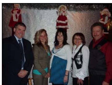
Dîner de Noël des gens d'affaires 2009