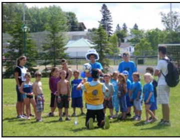
Activité: Bouge de là (août 2009)